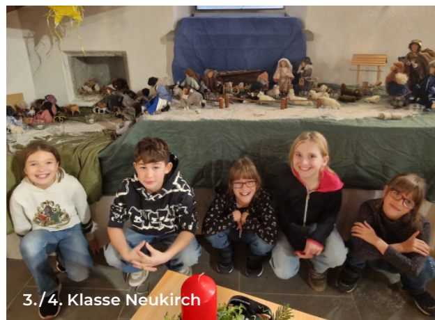
3./4. Klasse Neukirch