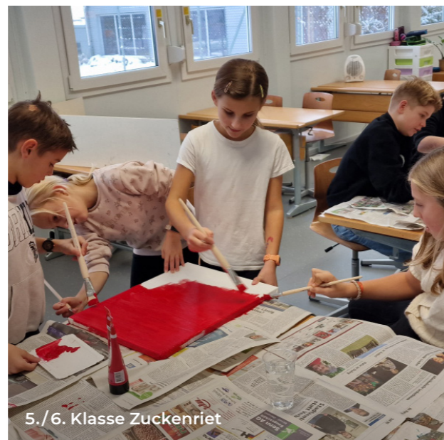
5./6. Klasse Zuckenriet