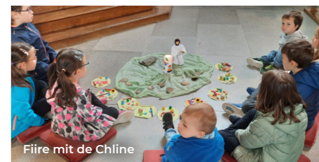
Fiire mit de Chline