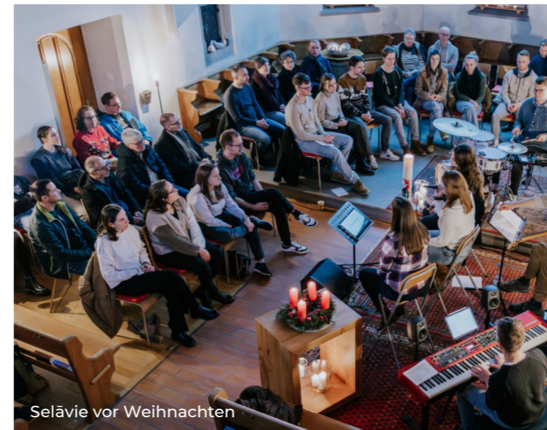
Selävie vor Weihnachten